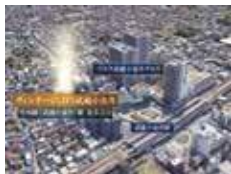
VINTAGE CITY 武蔵小金井 中央线『武蔵小金井』站 步行5分