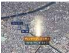
VINTAGE CITY 押上 半藏门线『押上』站 步行4分