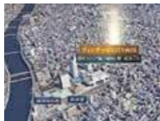
VINTAGE CITY 两国 都营大江户线『两国』站 步行7分